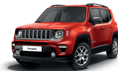
176 Czerwony Colorado (pastelowy)