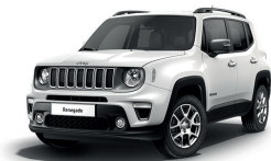
296 Biały Alpine (pastelowy)