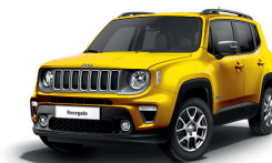
178 Żółty Solar (pastelowy)