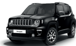
601 Czarny Solid (pastelowy)