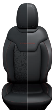
Tapicerka materiałowa / skórzana