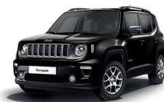
679 Grafitowy Graphite (metalizowany)