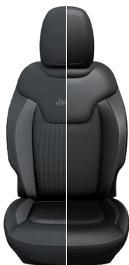
Tapicerka materiałowa / skórzana