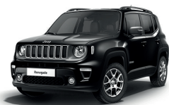
601 Czarny Solid (pastelowy)