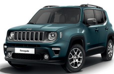
435 Niebieski Shade (metalizowany)