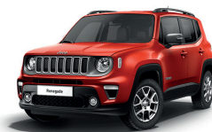
176 Czerwony Colorado (pastelowy)