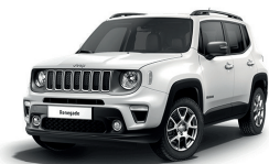
296 Biały Alpine (pastelowy)