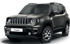
503 Sting Grey (pastelowy)